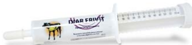
DIAR FRIVIT. Pienso complementario.