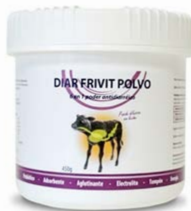
DIAR FRIVIT polvo. Pienso complementario.